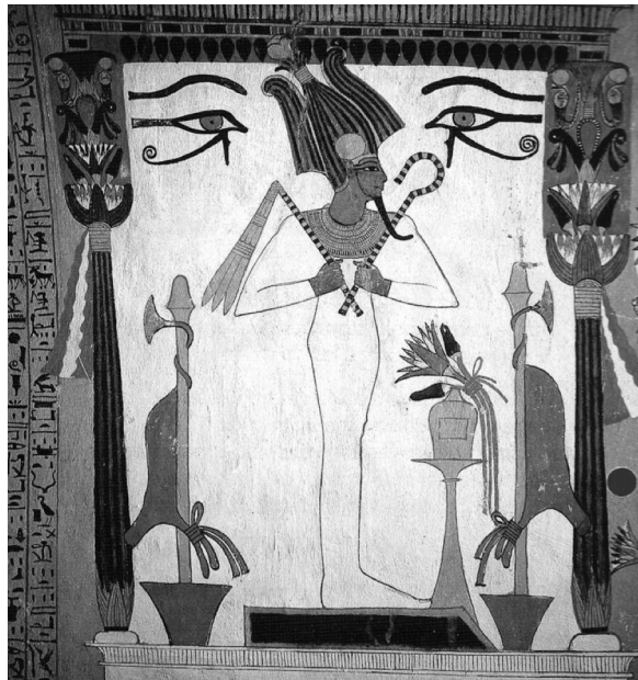
Osiris debout entouré par deux nébrides. Tombe de Senedjem. XIX e dynastie.

Le vert était également la couleur d' Osiris , dieu de la terre représenté avec la peau verte.