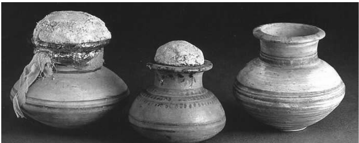
Pots à onguents, Égypte, XVIII ème dynastie, (env. - 1560 à - 1295), hauteur 12-13 cm, Musée du Louvre, Paris. ( Encyclopédia Universalis)

Les fleurs comme l'iris, le lotus bleu, la marjolaine et les résines comme celles du balsamier (myrrhe), du pistachier (térébenthine), du ciste (ladanum) et encore de l'aliboufier (benjoin) servaient de base à la préparation des parfums.